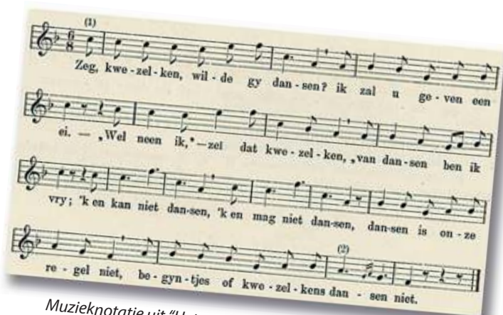
Muzieknotatie uit "Het oude Nederlandsche lied" (1905)

Zeg, kwezelken, wilde gij dansen is een volksliedje dat vooral bekend is in Vlaanderen, al bestaat het in Nederland ook, soms met de beginregel 'Zeg kwezeltje wil jij dansen?' Tegenwoordig heeft het de status van kinderlied. Het vrolijke liedje is een spotlied dat vrome vrouwtjes, kwezels, begijnen en/of nonnen belachelijk maakt. Het ganse lied door probeert de ik-persoon een kwezeltje tot dansen te verleiden en biedt hierbij allerlei zaken aan. Het kwezeltje wijst de persoon iedere keer resoluut af, tot hij haar voorstelt een man te zullen geven. Deze belofte overtuigt haar ogenblikkelijk om toch mee te dansen en wel 'al wat ik kan'.