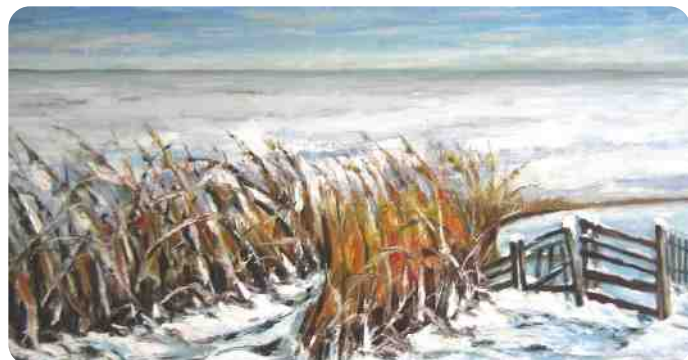
Henk Stappers olieverf op paneel