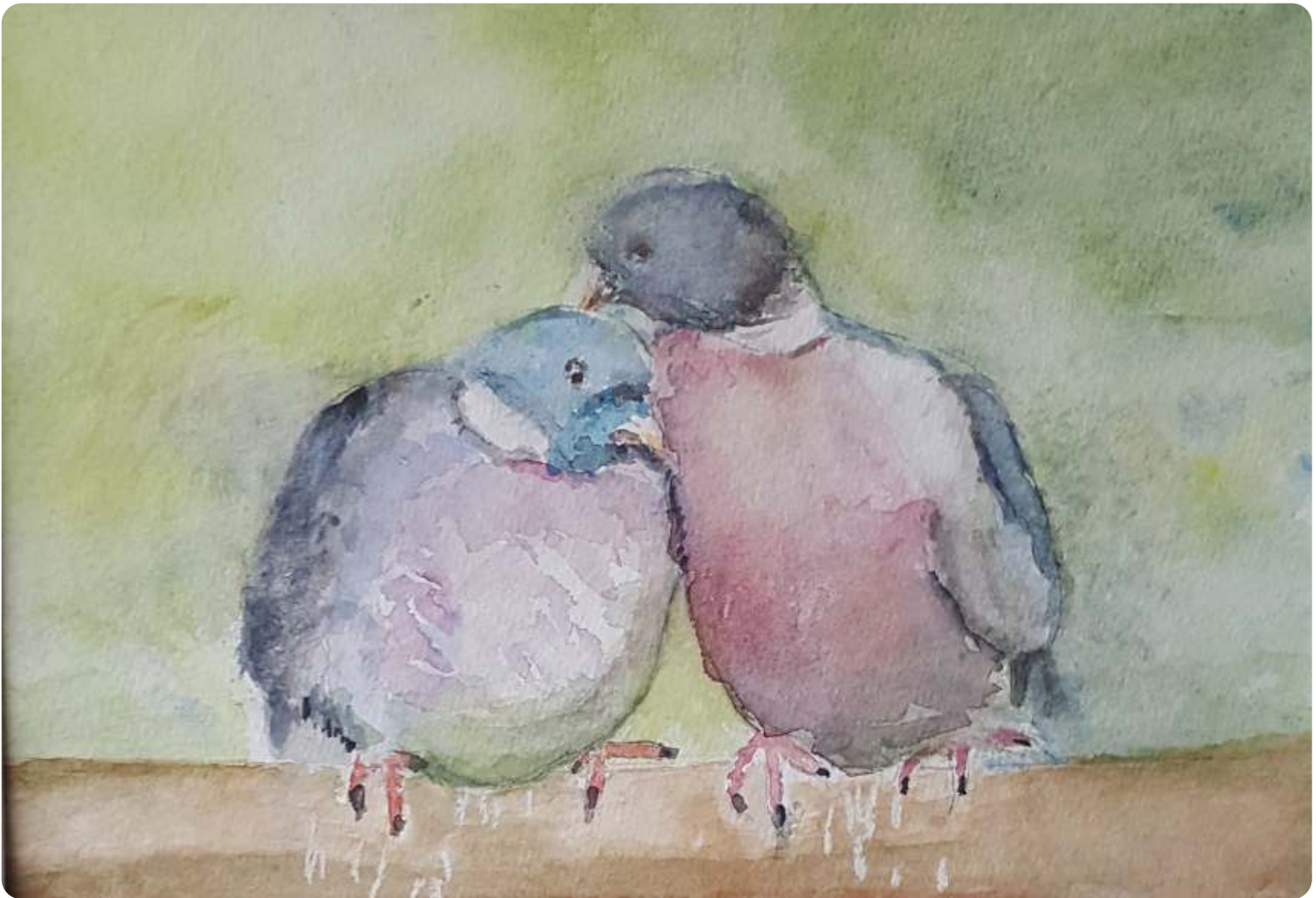
Gerda Dechamps, Hoogland, Tortel-echtpaar, aquarel