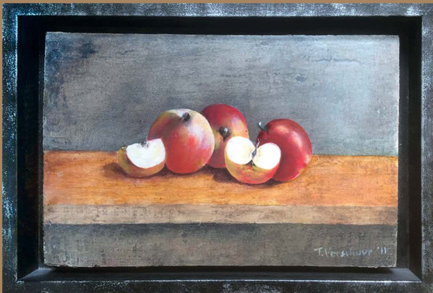
Thea Verschuur - Appels