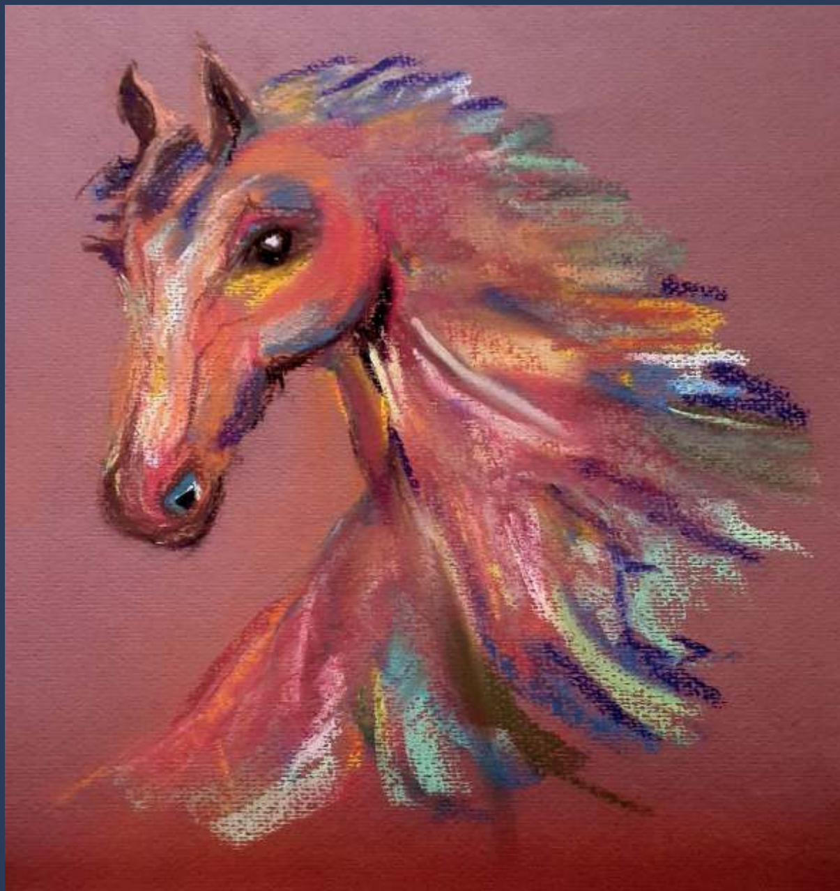
Sietske van der Glas