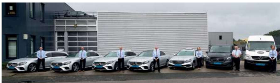
Groeps-, Rolstoel-, Schiphol-, School- en Taxivervoer Granpré Molièrestraat 7 - 3822 EV Amersfoort - www.taxiboute.nl

U kunt ook mailen naar info@taxiboute.nl