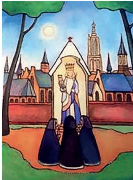
OL.Vrouw van Amersfoort door Toon Tieland - aangeboden door de omroeparochianen

Als u ook een keer wilt kijken naar de streaming van een viering, U vindt die op de website van Katholiek Amersfoort en Sint Franciscus Xaverius, dan onder het kopje bij vieringen online en vervolgens meekijken.