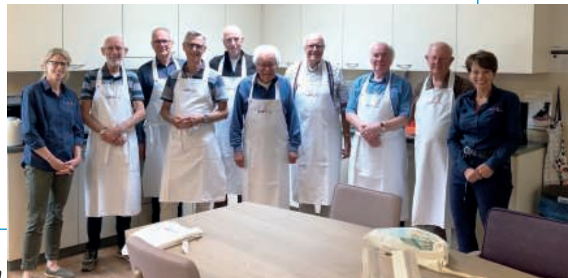
Kookcursus voor mannen