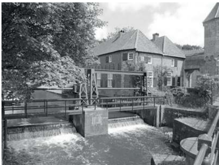
Voormalige volmolen bij de Koppelpoort

Reeds in de 15e eeuw was er lakennijverheid in Amersfoort. Met ups en downs bleven de textielproductie en -handel verscheidenen eeuwen bestaan. Tot in de 19e eeuw bleef het spinnen en weven echter voornamelijk huisindustrie met kleine bedrijven. Ook veel kinderen moesten meewerken. In de 17e eeuw moesten de wezen uit het 'Armen Weeskynderenhuis' een ambacht leren in de lint- en bombazijnweverij, die gevestigd was in het weeshuis in Mariënhof (bij de Grote Haag), of in het Lint- en Spinhuis aan de Muurhuizen. Er waren toentertijd in de stad zo'n vijftig drapiers(lakenfabrikanten) die samen meer dan honderd weefgetouwen bezaten. Met de spinsters, kamsters, kaardsters, ververs, enz. erbij bood de textielnijverheid veel werkgelegenheid.