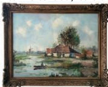
Het geboortehuis van Elly